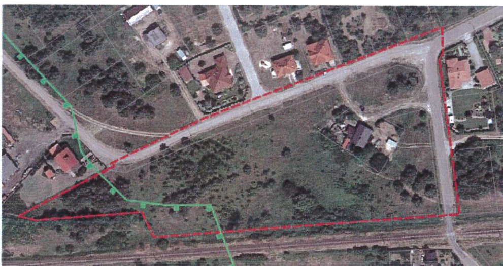
Ryc. Zasięg obszarów zagrożonych występowaniem ruchów masowych ziemi

Za wyjątkiem zachodnich krańców terenu, obszar opracowania jest niemal płaski. Deniwelacje nie przekraczają tu 2 m, a rzędne terenu kształtują się a poziomie od 52,2 do 53,8 m npm. Łagodny spadek obserwuje się w kierunku wschodnim. Ukształtowanie jest korzystne dla różnych form budownictwa. Nie ma również zagrożenia występowania zjawisk geodynamicznych ani ruchów masowych ziemi.