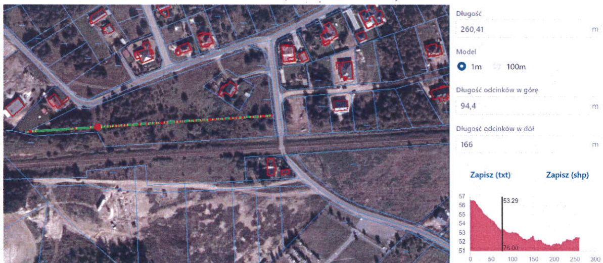
Ryc. Profil terenu

Pod względem geomorfologicznym teren ten stanowi fragment płaskiej, polodowcowej równiny morenowej, zbudowanej z gliny morenowej i piasków gliniastych. Najniższą położoną część gminy (północno-wschodnią) zajmuje Kotlina Toruńska, lokalnie zwana Niziną lub Kotliną Ciechocińską. Generalnie zajmuje ona tarasy zalewowe i akumulacyjno-erozyjne wzdłuż Wisły. Na wysokości miasta Ciechocinka i gm. Aleksandrowa Kujawskiego rozszerza się, a jej szerokość między krawędziami wysoczyzn morenowych osiąga od 12 do 15 km.