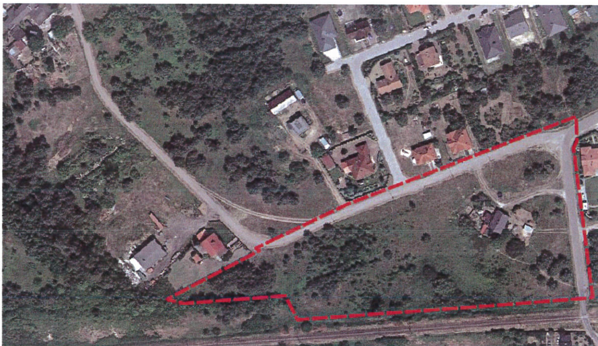
Ryc. Lokalizacja terenu objętego planem miejscowym

Obszar MPZP zajmuje powierzchnię ok. 1,85 ha. W jego granicach znajdują się głównie nieużytkowane od wielu lat tereny rolne porośnięte roślinnością murawową oraz samosiewami sosny. We wschodniej części terenu znajduje się jeden zdekapitalizowany budynek mieszkalny.