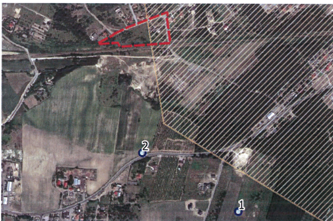
Ryc. Lokalizacja odwiertów archiwalnych i obszaru złoża wód leczniczych