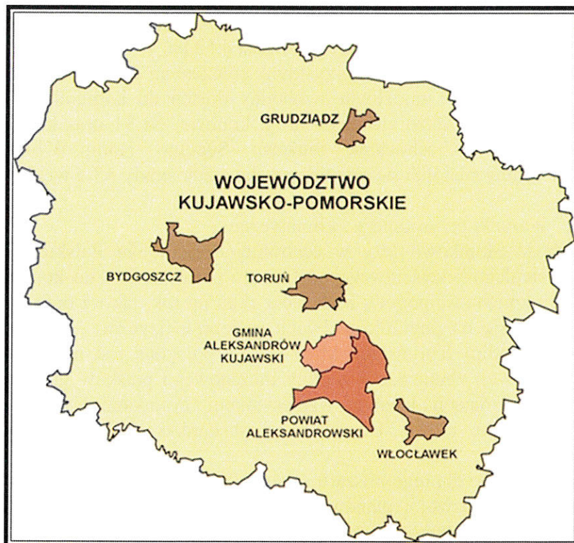
Położenie Gminy w układzie województwa Kujawsko - Pomorskiego