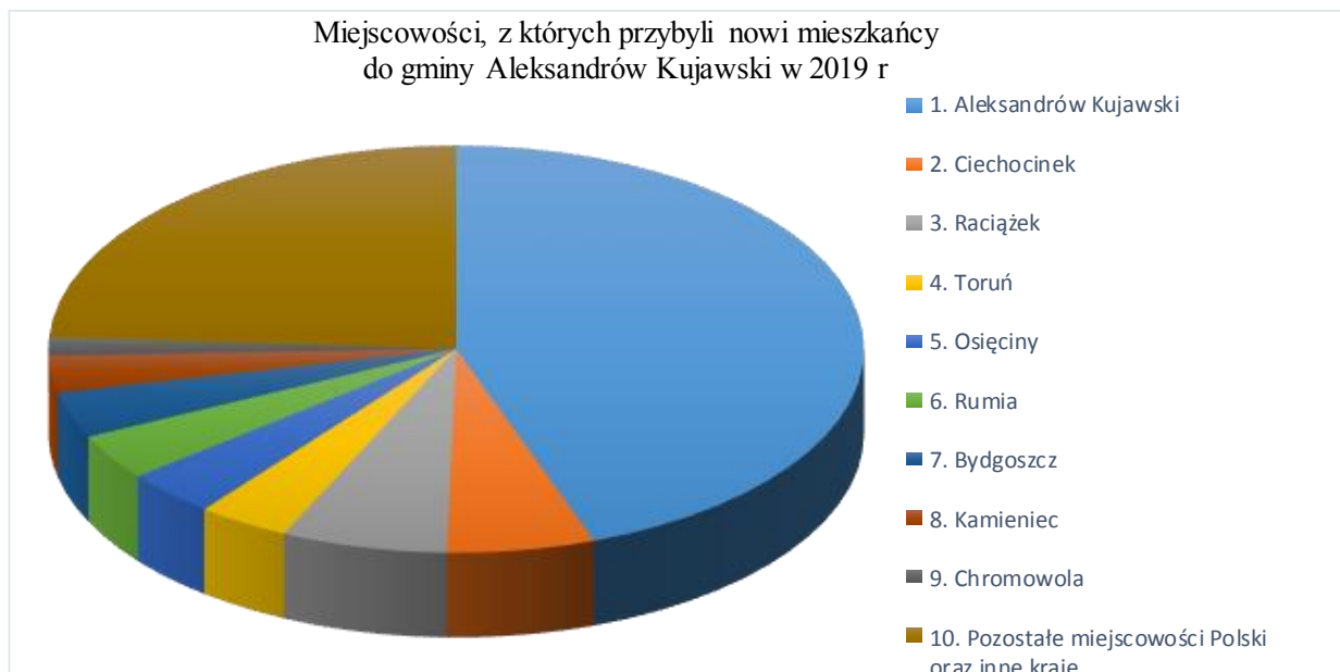
Miejscowości, z których przybyli nowi mieszkańcy do gminy Aleksandrów Kujawski w 2019 r