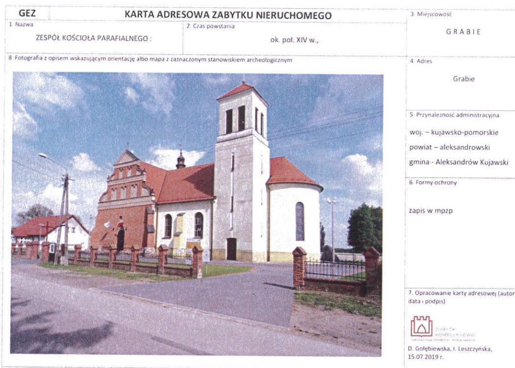
Rysunek 1 Przykładowa karta GEZ