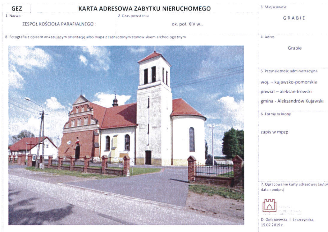
Rysunek 1 Przykładowa karta GEZ