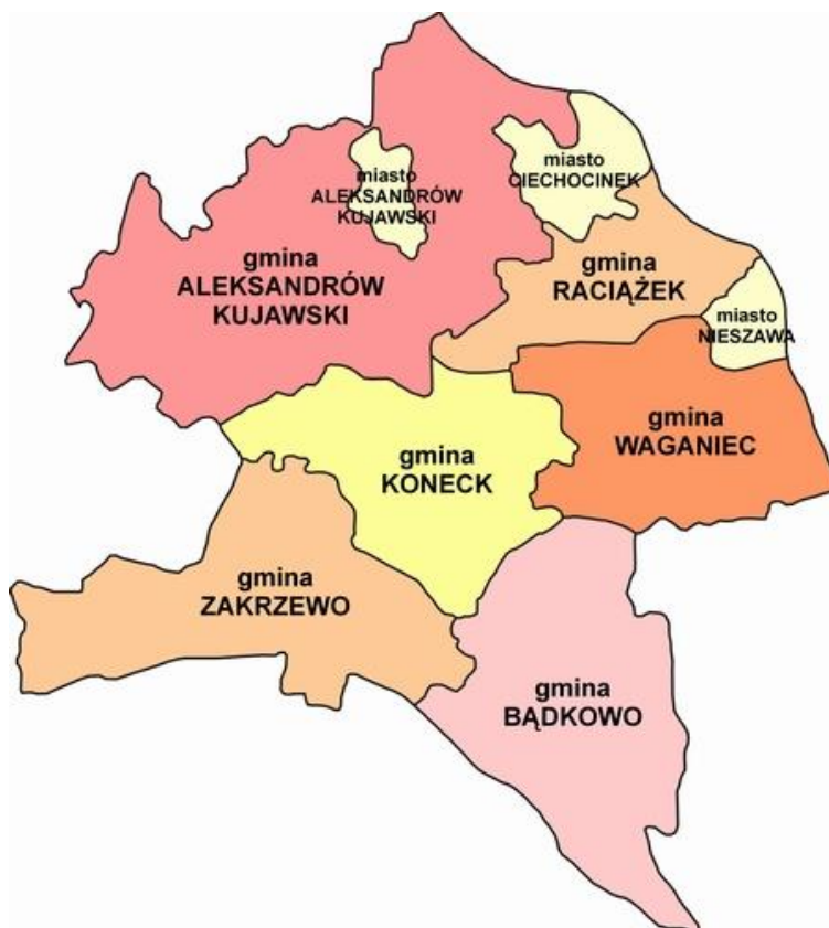
Położenie gminy Aleksandrów Kujawski na tle powiatu aleksandrowskiego

Gmina Aleksandrów Kujawski jest gminą wiejską, położoną w południowo-wschodniej części województwa kujawsko-pomorskiego, w powiecie aleksandrowskim. Siedzibą Urzędu Gminy jest Miasto Aleksandrów Kujawski. Powierzchnia gminy wiejskiej Aleksandrów Kujawski wynosi 131,64 km 2 i stanowi 27,68% powierzchni powiatu aleksandrowskiego. Gmina Aleksandrów Kujawski od wschodu graniczy z rzeką z Wisłą i miastem Ciechocinkiem. Od wschodu graniczy z gminą Raciążek, od południa z gminą Koneck (są to gminy powiatu aleksandrowskiego). Od południowego zachodu graniczy z gminą Dąbrowa Biskupia, a od zachodu z gminą Gniewkowo (gminy powiatu inowrocławskiego, byłe województwo bydgoskie), zaś od północy graniczy z gminą Wielka Nieszawka, a od północnego wschodu z gminą Obrowo (gminy powiatu toruńskiego, byłe województwo toruńskie).