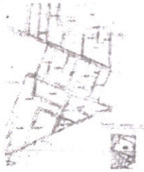
przykładowy miejscowy plan zagospodarowania przestrzennego

Plan miejscowy dotyczy części lub terenu całej gminy. Nie może naruszać ustaleń studium. Plan jest podstawą do wydawania pozwoleń na budowę.